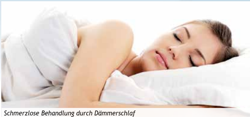
Schmerzlose Behandlung durch Dämmerschlaf

Wir bieten Ihnen diese Dämmerschlaf-narkose zu einem sehr günstigen Preis an.