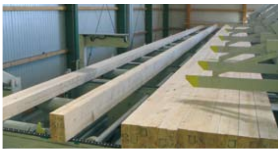
Vereinzelung von KVH, DUO und BSH mit Wendemöglichkeit für DUO