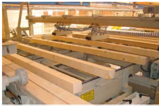
Hobelzuführung mit Mehrfachablängsäge