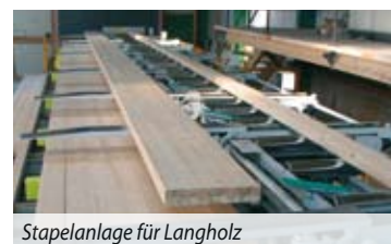
Stapelanlage für Langholz