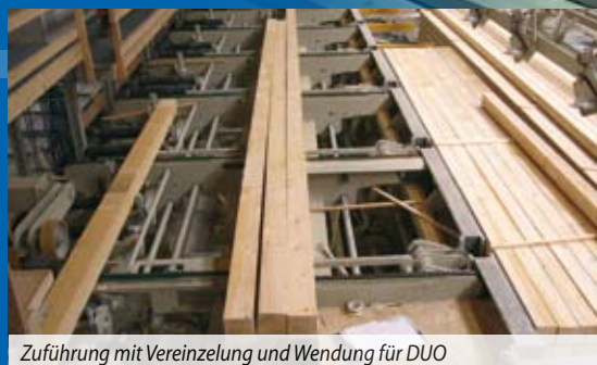
Zuführung mit Vereinzelung und Wendung für DUO