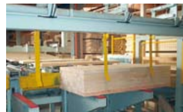
Stapelanlage für Kurzholz