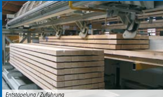
Entstapelung / Zuführung

Die Hobelmaschinenmechanisierungen werden in verschiedenen Ausführungen nach jeweiligem Kundenbedarf gebaut. Die Firma H.I.T. liefert komplette Hobellinien für Lang- und Kurzholz.