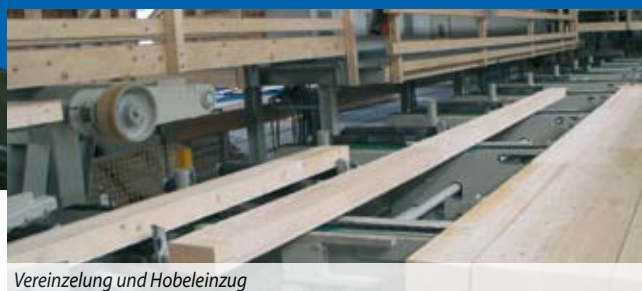
Vereinzelung und Hobeinzug