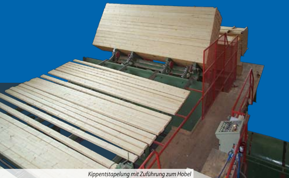
Kippentapelung mit Zuführung zum Hobel

MASCHINEN- UND STEUERUNGSBAU FÜR HOLZ INDUSTRIE TECHNIK