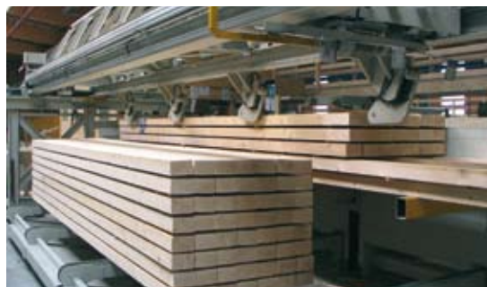
Lagenabschiebeentapelung für Langholz

Nach der Hobelmaschine können die Hölzer in Etagen sortiert werden. Die automatische Stapelung kann mit oder ohne Lattenlegung erfolgen. In die Hobellinien können verschiedene Anlagen wie Mehrfachablängsäge, Feuchtemessung, Scannersysteme und Etikettierungen integriert werden.