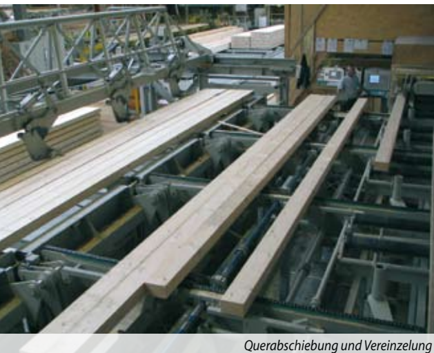
Querabschiebung und Vereinzelung